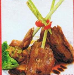
อกไก่อบคอนปีกตะใคร้